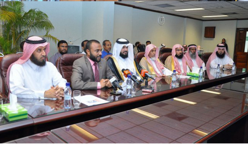
بۇ تەسۋىرلەردىن ئىبارەتتۇر. بۇ تەسۋىرلەردىن ئىبارەتتۇر بۇ تەسۋىرلەردىن ئىبارەتتۇر. بۇ تەسۋىرلەردىن ئىبارەتتۇر.